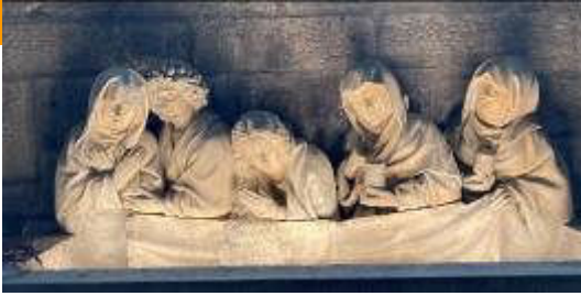
Église saint Michel de Dijon, mise au tombeau