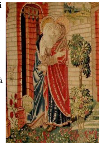
Notre-Dame de Beaune : Rencontre d'Anne et Joachim

Chères grands-mères et chers grands-pères, chères personnes âgées, nous sommes appelés à être dans notre monde des artisans de la révolution de la tendresse ! Faisons-le en apprenant à utiliser toujours plus et toujours mieux l'instrument le plus précieux que nous avons, et qui est le plus approprié à notre âge : celui de la prière. Que ma Bénédiction parvienne à vous tous et aux personnes qui vous sont chères, avec l'assurance de mon affectueuse proximité. Et, s'il vous plaît, n'oubliez pas de prier pour moi !