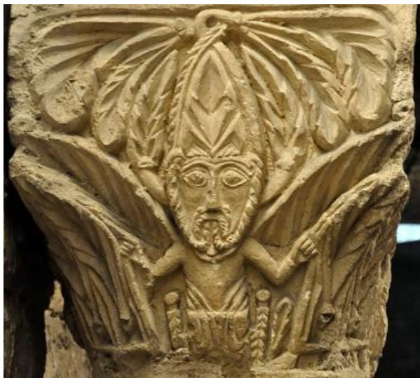
"Le juste fleurira comme un palmier" (Psaume 91) chapiteau de la rotonde de la cathédrale, XI e siècle

Seigneur, je ne suis pas digne de te recevoir, mais dis seulement une parole et je serai guéri.